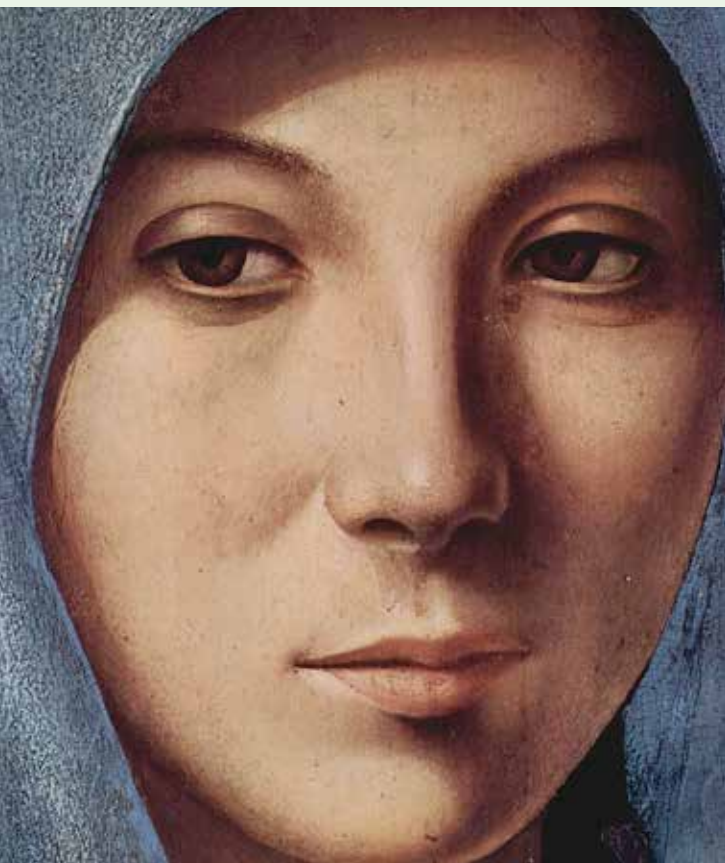
L'Annunciata di Palermo, olio su tavola, 1475, Antonello da Messina